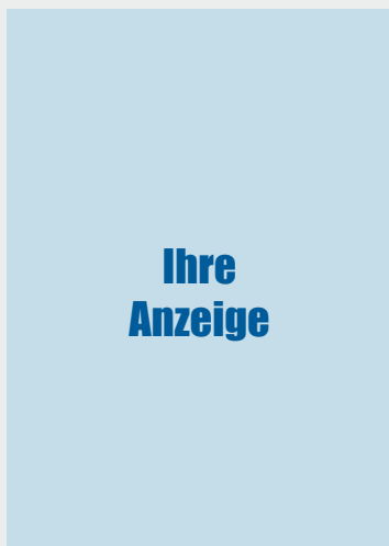
Format: 210x297mm zzgl. 3mm Randbeschnitt